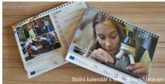
Stolní kalendář s tematikou vzdělávání