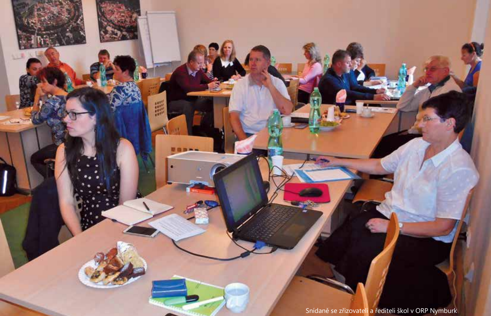
Snídaně se zřizovateli a řediteli škol v ORP Nymburk