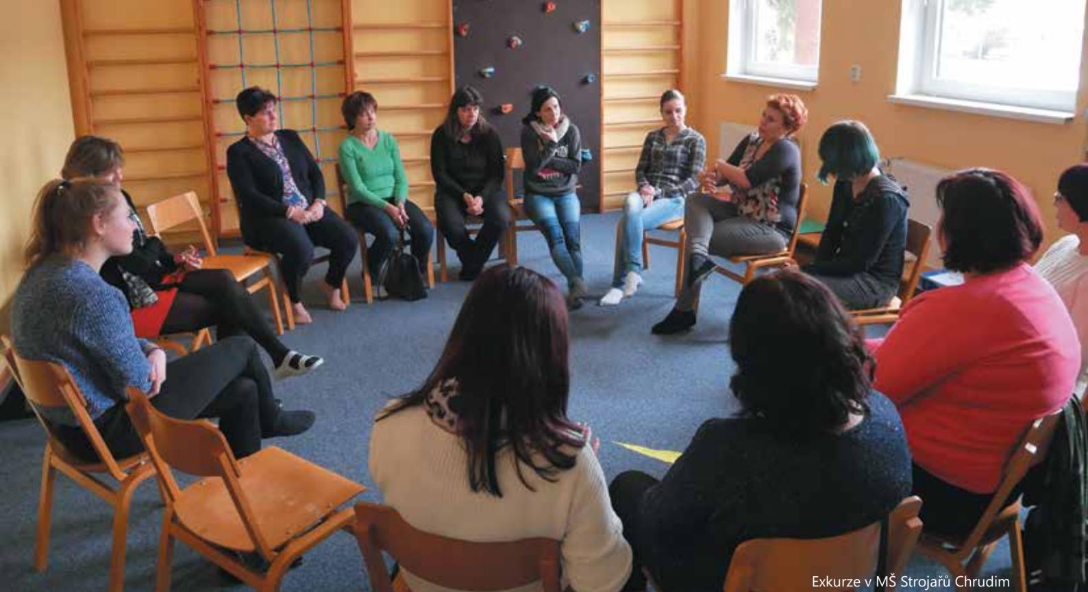
Exkurze v MŠ Stojářů Chrudim