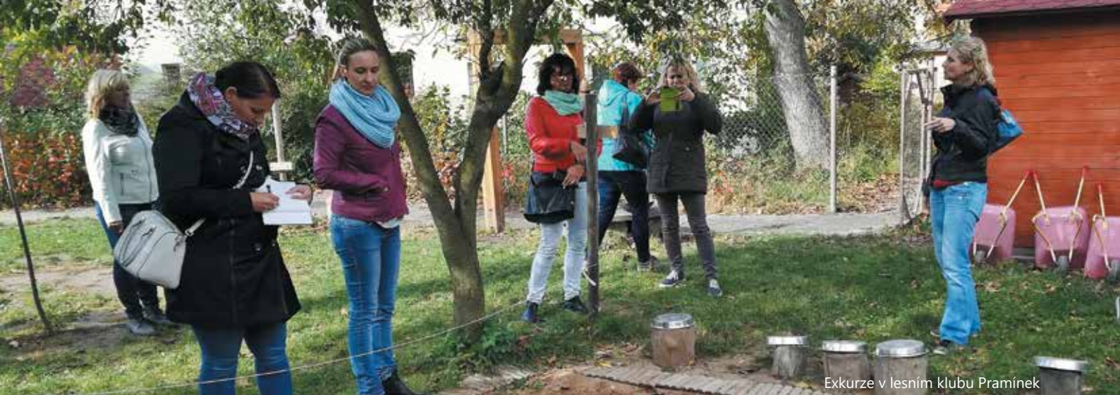
Exkurze v lesním klubu Prámínek