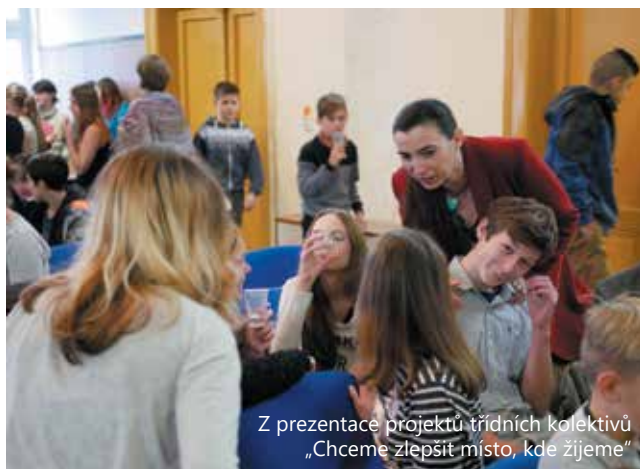
Z prezentace projektů třídních kolektivů „Chceme zlepšit místo, kde žijeme“