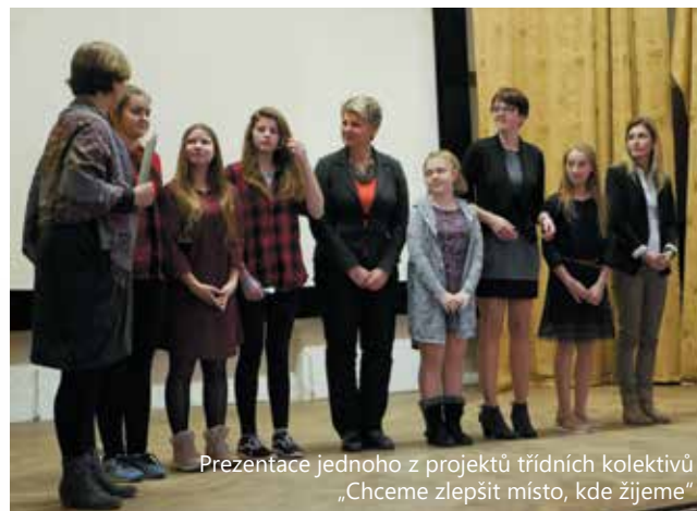
Prezentace jednoho z projektů třídních kolektivů „Chceme zlepšit místo, kde žijeme“